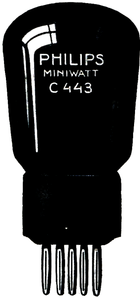
\frac{3}{4} nat. Gr.

Die C 443 ist nach den selben Grundsätzen entworfen wie die B 443. Sie unterscheidet sich von dieser nur durch die höhere Anoden- und Schirmgitterspannung und den höheren Anodenstrom, so dass die unverzerrt abgegebene Höchstleistung viel grösser als die der B 443 ist; hierdurch wird auch in grossen Wohnräumen eine genügende Lautstärke erzielt.